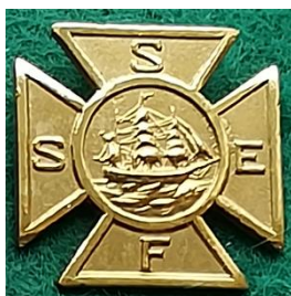
H 9.7 SSEF Svenska Sjömans- Eldareförbundet. (S.R.256)