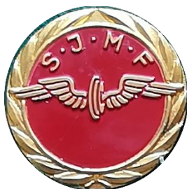
H 5.4 SJMF, Svenska Järnvägsmannaförbundet förtjänstmärke. (S.R.51)