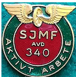
H 5.6 SJMF avd 340, Svenska Järnvägsmannaförbundets avdelning i Halmstad, troligen ett förtjänstmärke. (S.R.828)