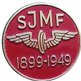
H 5.2 SJMF 1899-1949, Svenska Järnvägsmannaförbundet. (S.R.51)