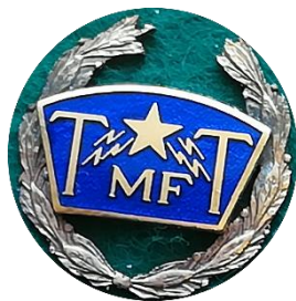
H 3.4 TmfT , Telegraf och Telefonmannaförbundet förtjänstmärke. (S.R.804)