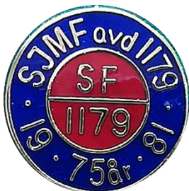
H 5.8 SJMF avd. 1179 SF 1179 75 år 1981.