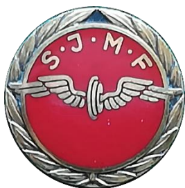
H 5.3 SJMF, Svenska Järnvägsmannaförbundet förtjänstmärke i stämplat silver, märkt Z8=1949 (S.R.51)