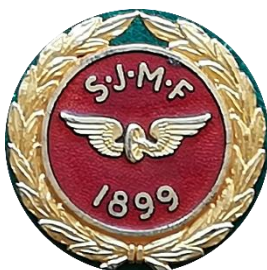
H 5.5 SJMF 1899, Svenska Järnvägsmannaförbundet förtjänstmärke i stämplat silver, märkt E9=1955. (S.R.51)