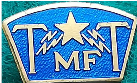
H 3.3 T m f T , Telegraf och Telefonmannaförbundet. (S.R.3)